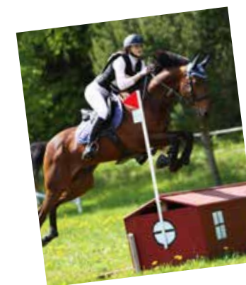
Hest Ride- og køyresport