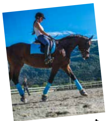
2. års hestesport