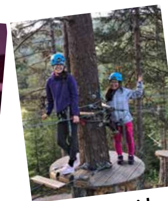
Bu og fritid