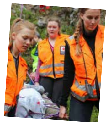
Friluftsliv i samarbeid med Røde Kors