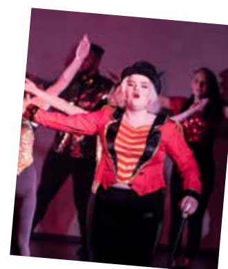
Musikal – West End