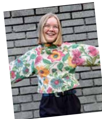
Kreativ saum og strikk