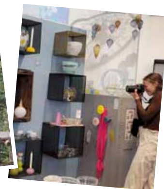
Kunst – Foto – Glas – Reise